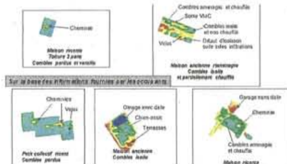
Ces clichés montrent la capacité de précision de l'étude.