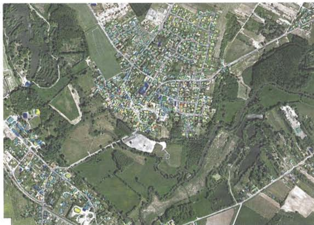
Cette photographie, prise par l'avion du Laboratoire national d'essais montre une commune de l'agglomération, de nuit, et par grand froid. Les couleurs disent tout sur l'énergie que vous gaspillez !

A savoir si votre habitation a besoin de travaux d'isolation. Là, ce sont les personnes pré-