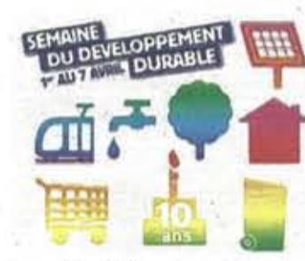
La suite, déjà, pendant la Semaine du développement durable.