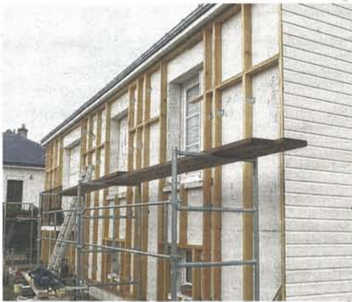
Bien choisir son mode d'isolation : c'est indispensable. Mais sans perdre de vue son budget.